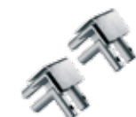
M-DESIGN Eckverbinder zweiseitig