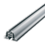
M-DESIGN Schiene zweiseitig